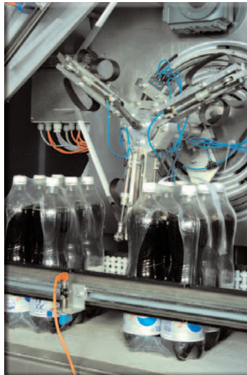
▼ Packung im Eingriff